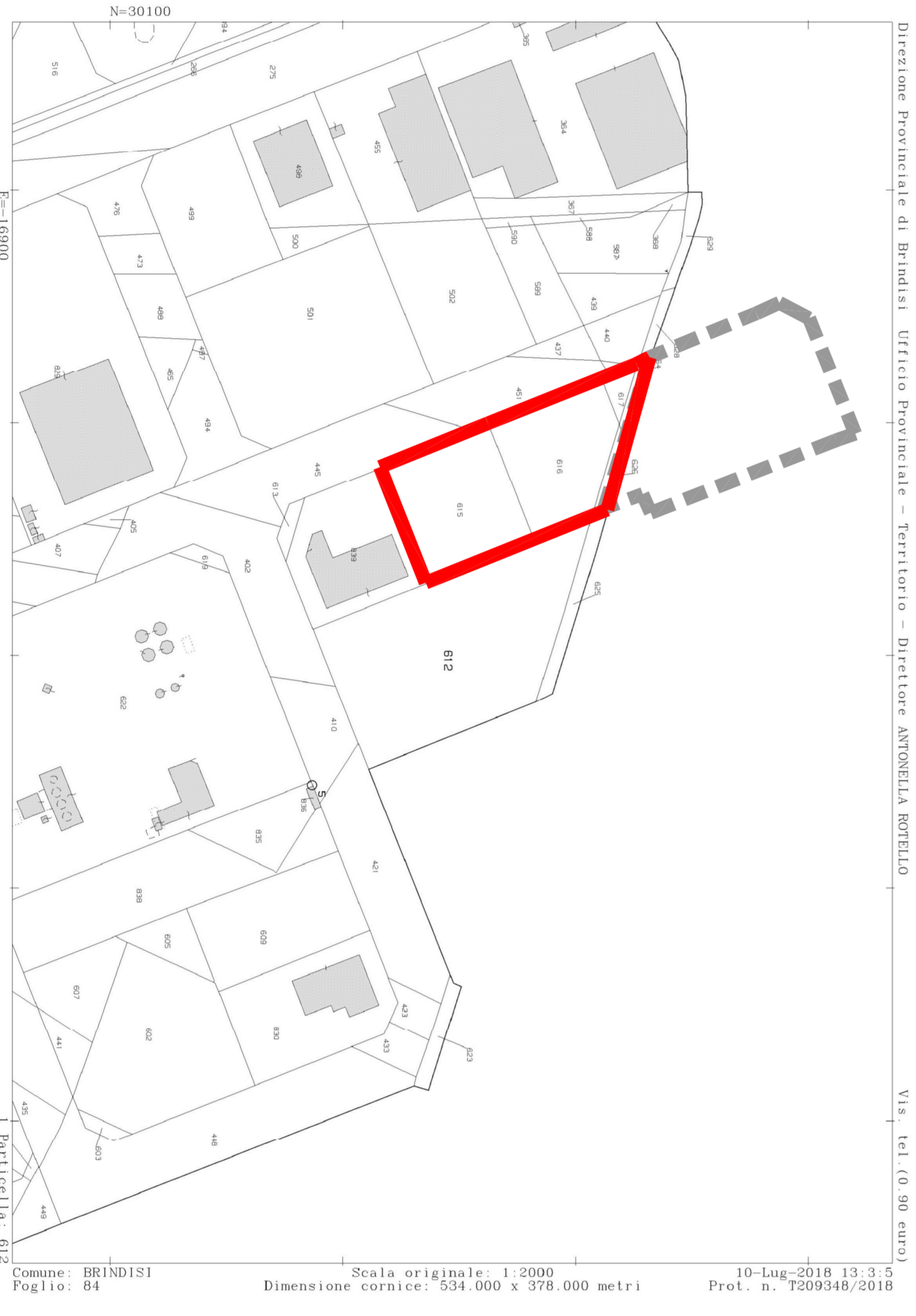
STRALCIO CATASTALE scala 1:2000